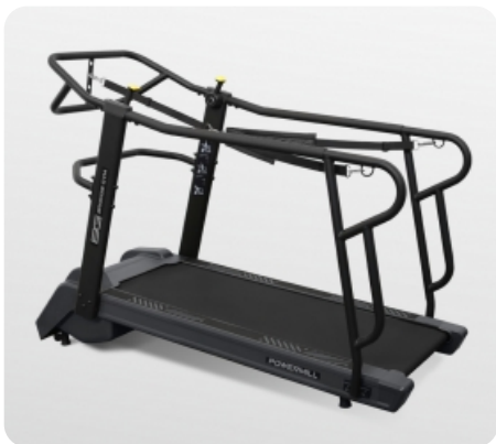
Вид с фиксирующими ремнями