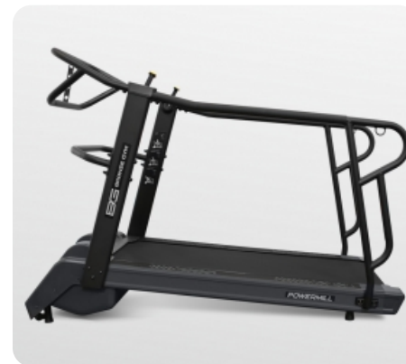
Угол наклона 21% для большего сопротивления