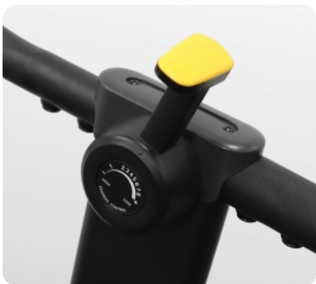
Рукоятка регулировки нагрузки (8 положений)