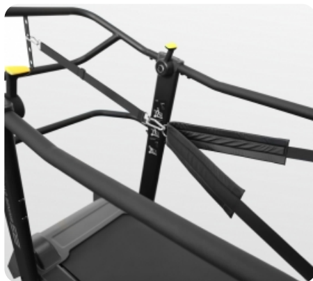
Фиксирующие ремни и карабины