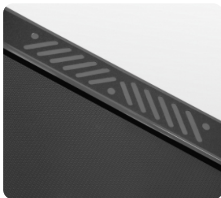
Прорезиненные накладки на деку для лучшей устойчивости